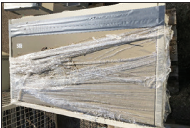
Falsch / unvollständig abgeklebt

Hinweis: Nachtspeichergeräte lieber über eine Fachfirma mit Sachkundenachweis demontieren und entsorgen lassen anstatt selbst Hand an die Geräte zu legen.